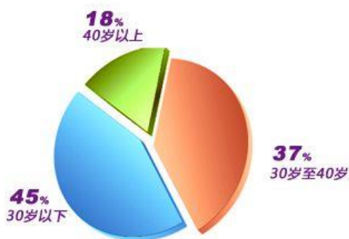
全行人员年龄结构