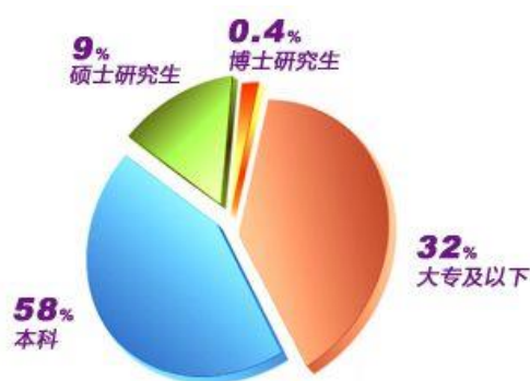
全行人员学历结构