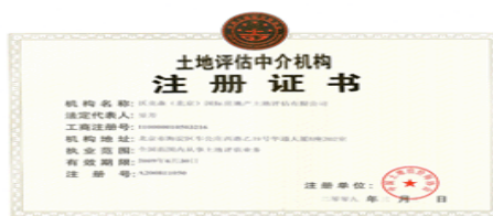
6 中国土地估价师协会颁发的《全国范围内从事土地评估业务证书》