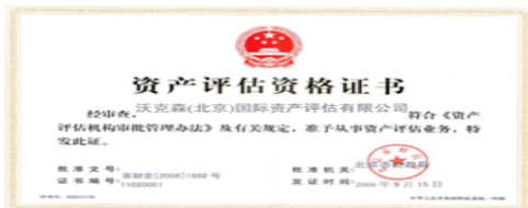
3 北京市财政局颁发的《资产评估资格证书》