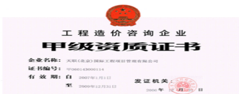
5 建设部颁发的《工程造价咨询单位甲级资质证书》