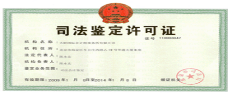
7 北京市司法局颁发的《司法鉴定许可证》