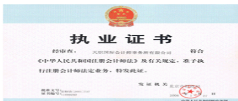
1 北京市财政局颁发的《执业证书》