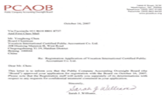
9 美国公众公司监督委员会颁发的执业资格