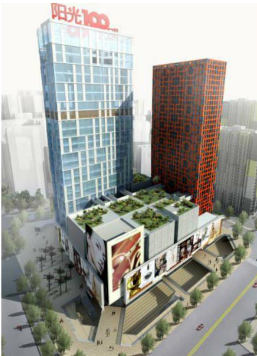
C1 整体立面效果（左边高楼为 25#办公公寓，矮的是 26#商业，27#红色建筑是精装住宅）